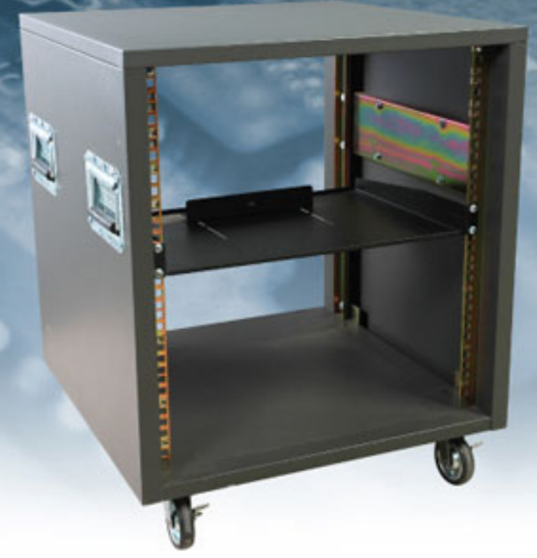
Quick Rack 19" QR-12U