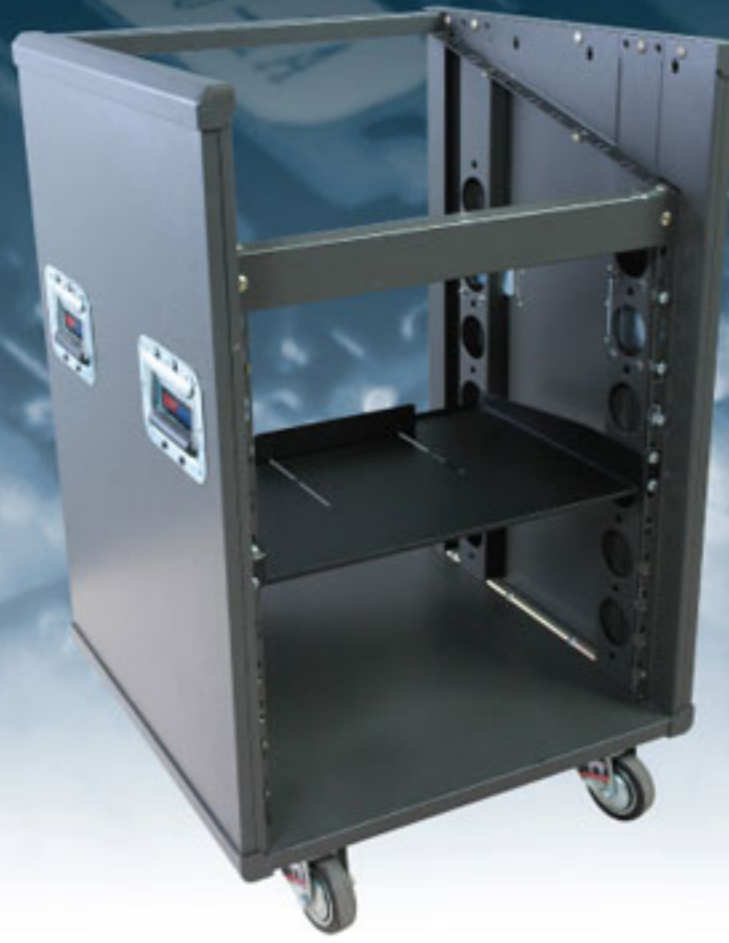
Move Rack 19" With Mixer MRm-12U