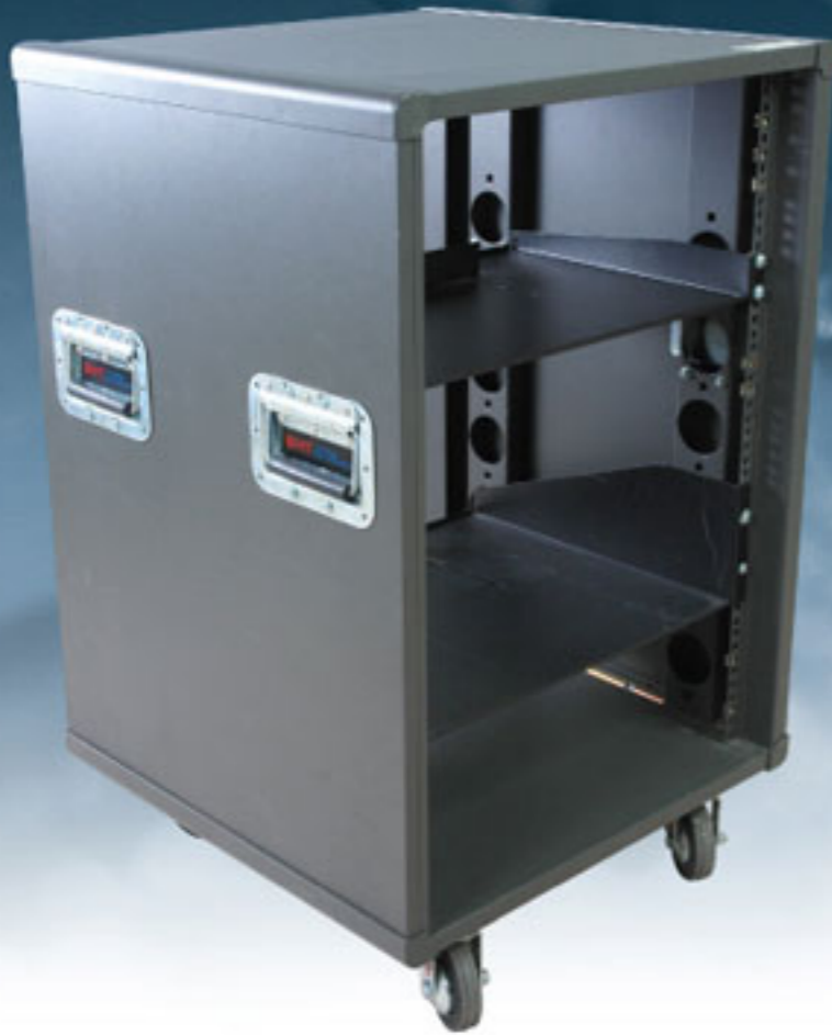
Move Rack 19" MR-16U