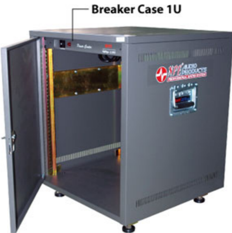
Quick Rack 19" With Panel QRp-13U